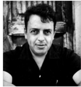
1928 - Jorge Ibarguengoitia Antillón

Fue una mezzosoprano mexicana de fama mundial, que desarrolló una intensa carrera artística, además de ejercer la educación universitaria de cantantes en diversas instituciones públicas y privadas.