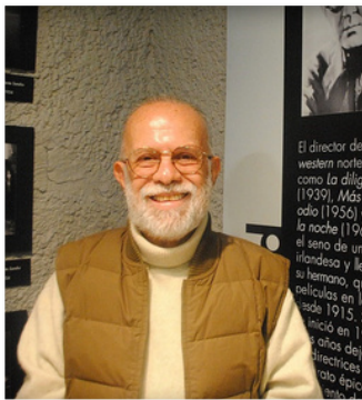
1942 - Jaime Humberto Hermosillo Delgado

Fue un escritor mexicano cuya obra abarcó diversos géneros como dramaturgia, crítica novela, cuento y crónica. Actualmente es considerado como uno de los escritores más influyentes en la literatura latinoamericana.