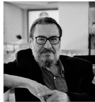
1947 - José Vicente Anaya

Fue un guionista y cineasta mexicano, conocido por sus películas “La pasión según Berenice” y “La tarea”, entre otras. Su obra se enfocó en la familia de clase media, los prejuicios, la sexualidad y la ruptura del orden moral.